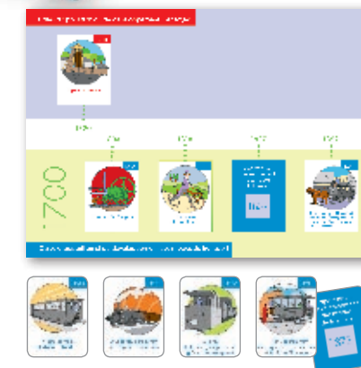
Activité 2 • Fresque historique avec cartes