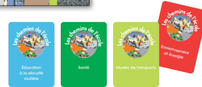
Activité 1 • Cartes à jouer « Les chemins de l'école »